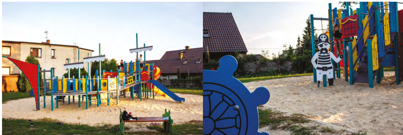
Żernica (ul. Szafranka) - Morski plac zabaw