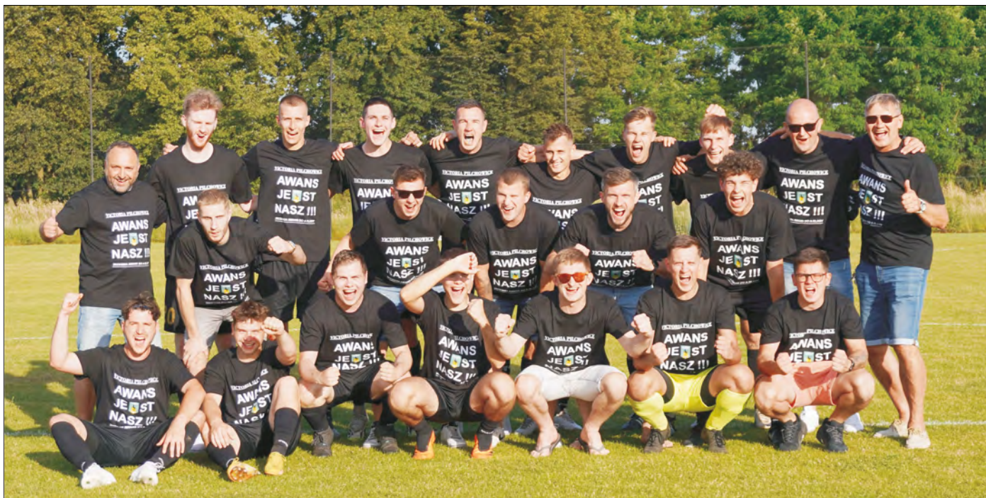
Awans jest nasz - tak cieszyli się piłkarze Victorii Pilchowice po zwycięstwie 6:0 w wyjazdowym meczu z Orłem Paczyna i jednocześnie przypieczętowaniu awansu do Klasy A.