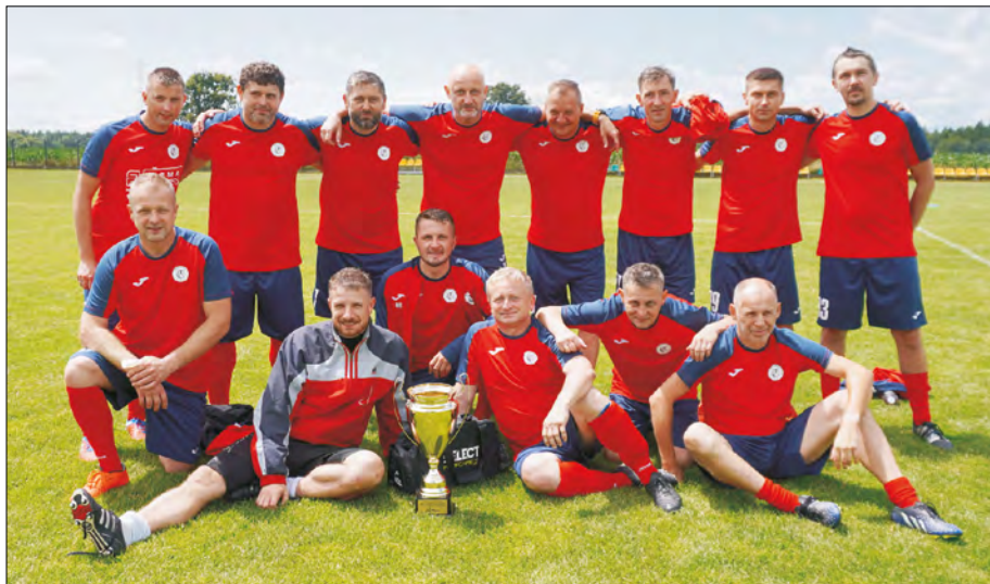
Oldboje z Wilczy z pucharem przechodnim wójta gminy Pilchowice.

22 czerwca w Stanicy rozegrano 9. Turniej Piłkarski Oldbojów o Puchar Przechodni Wójta Gminy Pilchowice.