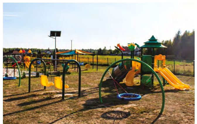
Kuźnia Nieborowska - Kasztanowy plac zabaw