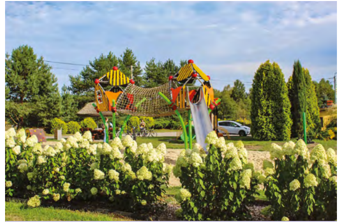
Leboszowice - Tropikalny plac zabaw