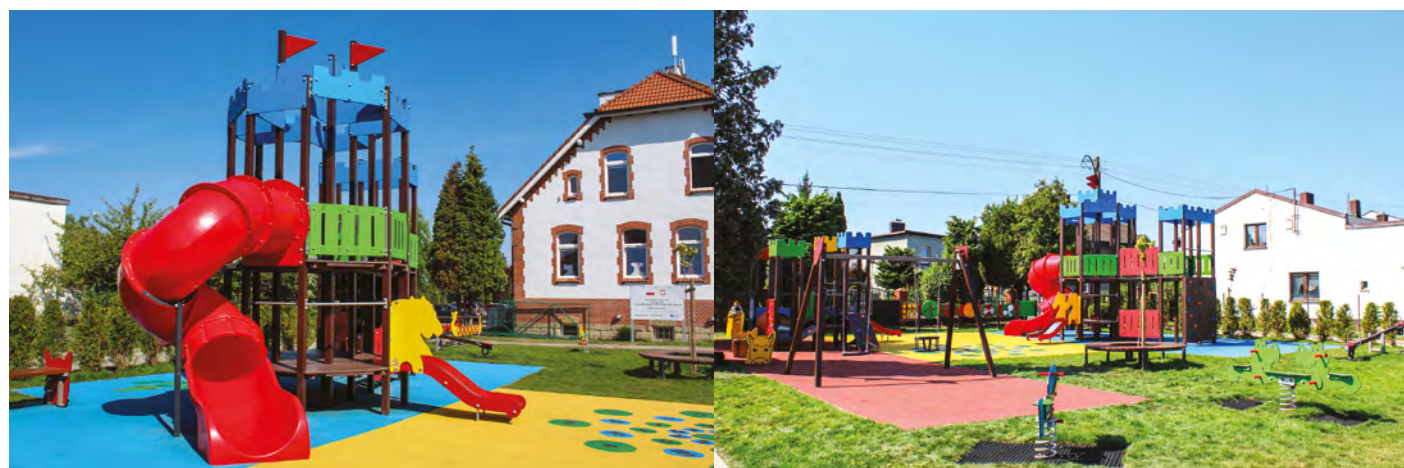
Wilcza (przy ZSP) - Zamkowy plac zabaw