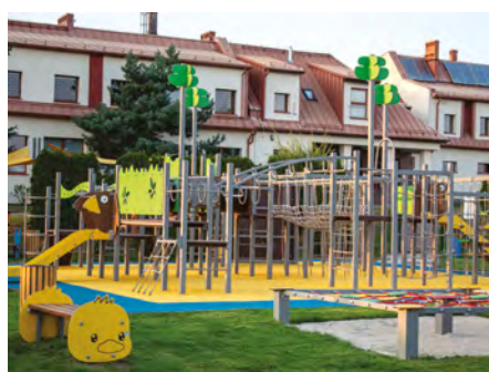
Żernica (ul. Leopolda Miki) - Plac zabaw nasze zwierzaki