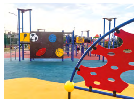
Wilcza (przy LKS) - Sportowy plac zabaw