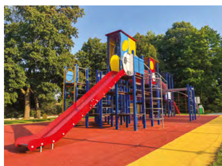
Pilchowice (przy ZSP) - Sportowy plac zabaw