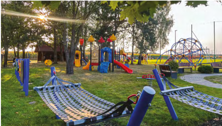
Stanica - Sprawnościowy plac zabaw

Całkowity koszt zadania opiewa na kwotę ponad 11 mln zł, z czego 7,2 mln zł to kwota dofinansowania z Rządowego Funduszu Polski Ład: Program Inwestycji Strategicznych – edycja druga, a 539 672,00 zł to kwota dotacji celowej z budżetu Górnośląsko-Zagłębiowskiej Metropolii w ramach Funduszu Odporności na 2024 rok. (KKW)