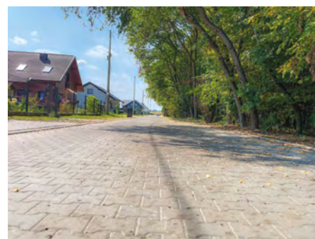
Ul. Jesionowa w Pilchowicach

Do tej pory 2 z ww. odcinków dróg zostało oddanych do użytku: ul. Jesionowa, a także jedna z dróg bocznych od ul. Wielopole (druga droga boczna tej ulicy jest w trakcie przebudowy).