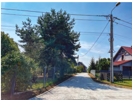
Droga boczna od ul. Wielopole w Pilchowicach

Przypominamy, inwestycja obejmuje m.in.: przebudowę jezdni, budowę ronda na skrzyżowaniu ulic: Gliwicka, Powstańców, Bierawka, budowę nowych oraz przebudowę istniejących chodników, a także ciągów pieszo-rowerowych. Postępy prac można na bieżąco sprawdzić na stronie internetowej www.dw921-pilchowice.pl . Tam też opublikowane zostały podstawowe informacje dotyczące tej inwestycji. Choć wiemy, że ruch wahadłowy bywa uciążliwy, to prosimy o jeszcze chwilę cierpliwości. Już niedługo będzie pięknie i przede wszystkim bezpiecznie.