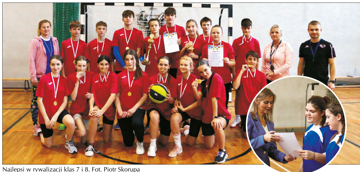
Najlepsi w rywalizacji klas 7 i 8.