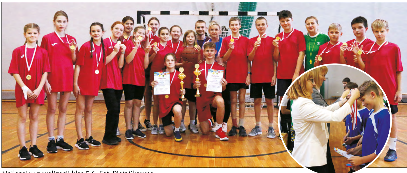
Najlepsi w rywalizacji klas 5-6.