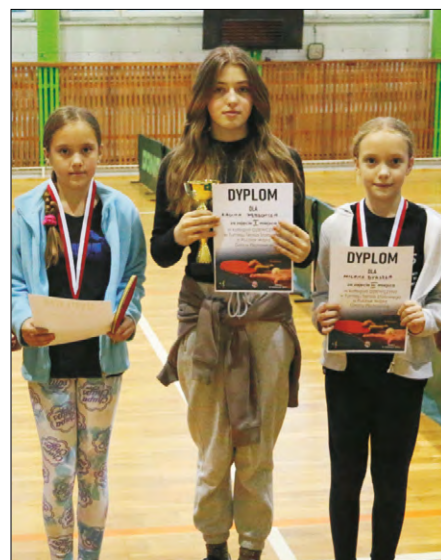
Podium w kategorii dziewcząt.