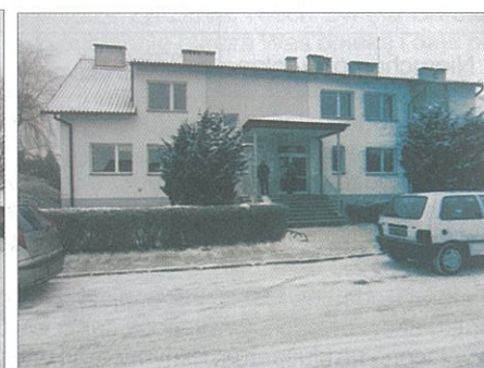
Ośrodek zdrowia w Żernicy po pracach termomodernizacyjnych.