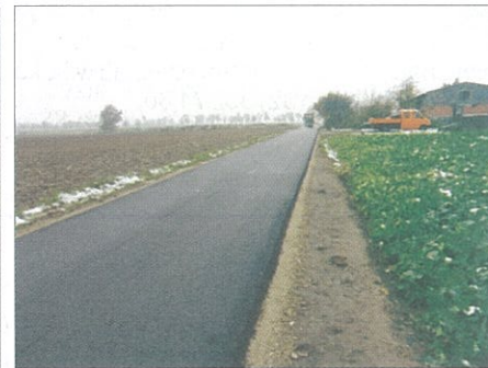
Plany inwestycyjne objęły również przebudowę dróg transportu rolnego.