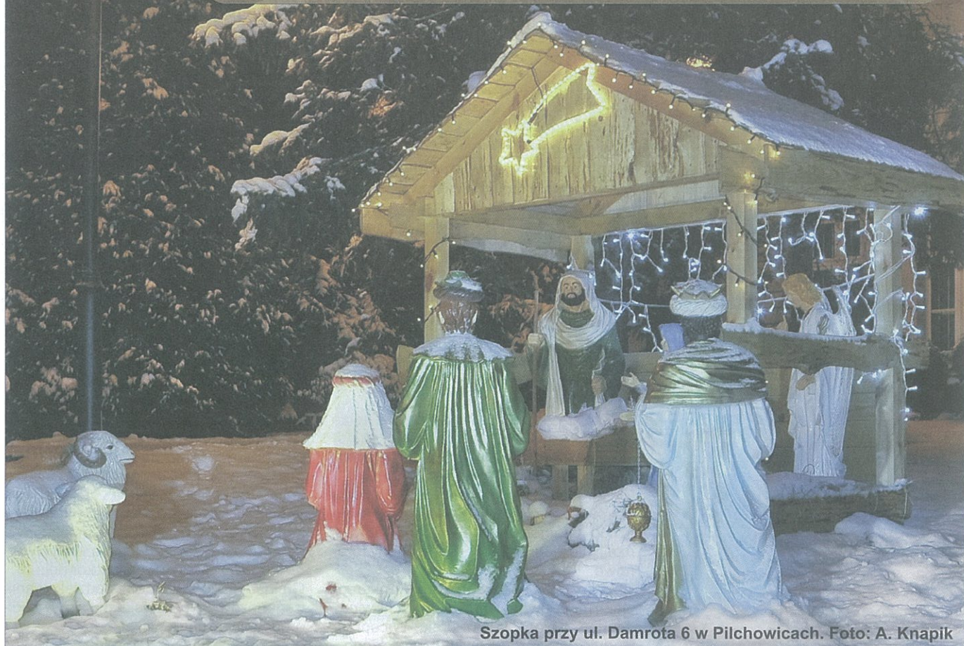
Szopka przy ul. Damrota 6 w Pilchowicach.

Wójt Gminy Pilchowice Joanna Kołoczek-Wybierek z pracownikami urzędu