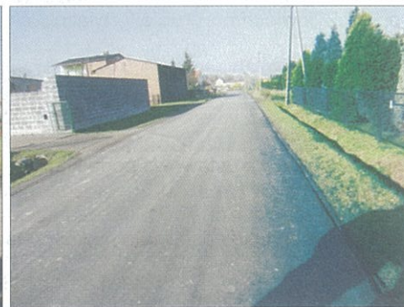
Wilcza, ul. Grzonki - przed i po remoncie.