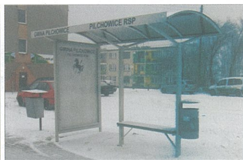
Przystanek autobusowy przed i po zakupie nowych wiat.