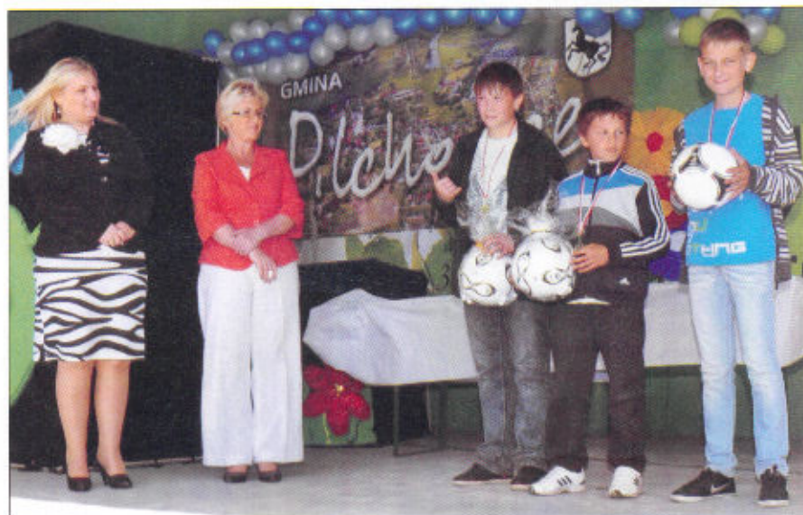
Najlepsi strzelcy i bramkarz turnieju.