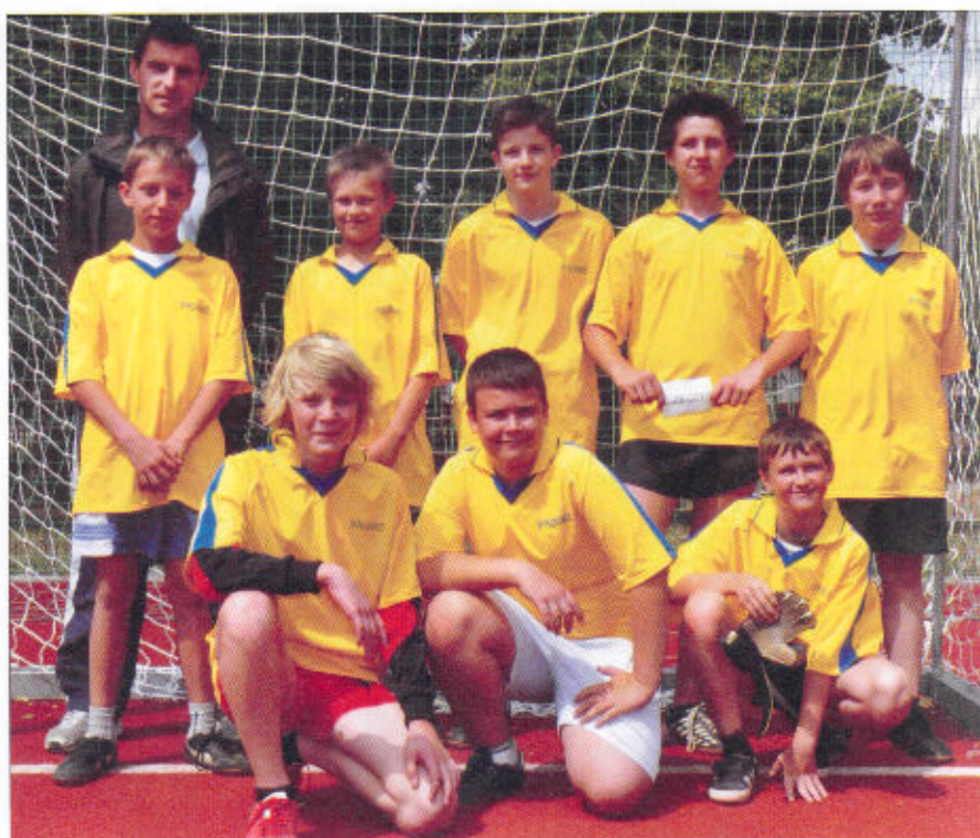
Gminne EURO wygrali uczniowie z Pilchowic.

Zdaniem organizatorów i opiekunów drużyn, miano najlepszego bramkarza turnieju przypadło Konradowi Szopie ze Stanicy.